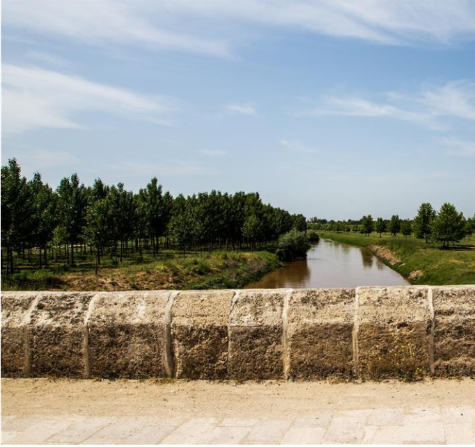
Şekil 2: T.C. Kültür Turizm Bakanlığı, Sultan II. Bayezid Külliyesi Sağlık Müzesi, Tunca Nehri