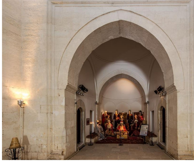
Şekil 5: T.C Trakya Üniversitesi, Sultan II. Bayezid Külliyesi Sağlık Müzesi, Müzikle tedavi