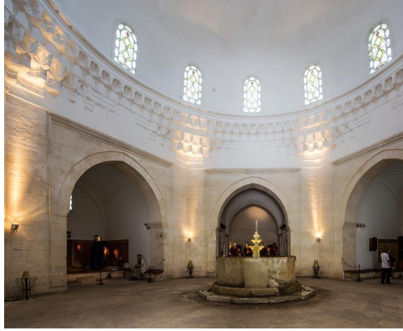
Şekil 4: T.C Trakya Üniversitesi, Sultan II. Bayezid Külliyesi Sağlık Müzesi, Şifahane bölümü.