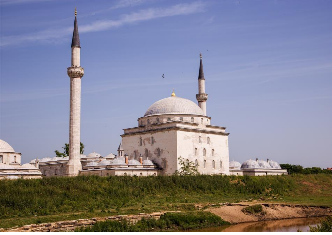
Şekil 1. T.C. Kültür Turizm Bakanlığı, Sultan II. Bayezid Külliyesi Sağlık Müzesi